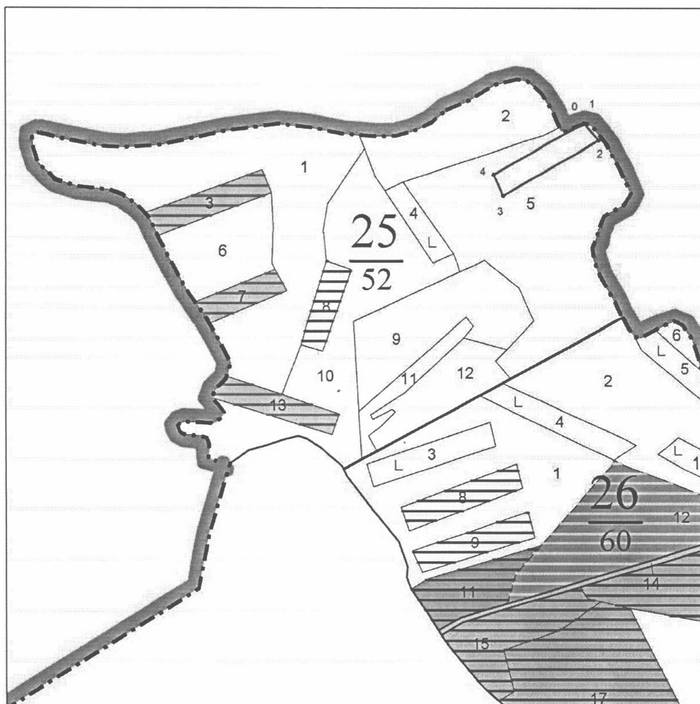
Схема расположения мест при проведении работ при использовании лесов в 2026 году Лесничество (лесопарк) – Обоянское, Обоянское участковое лесничество квартал 25, выдел 5